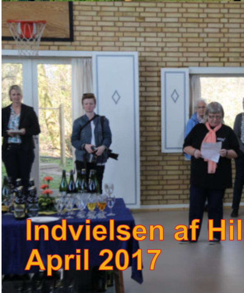
Indvielsen af Hillerslev April 2017