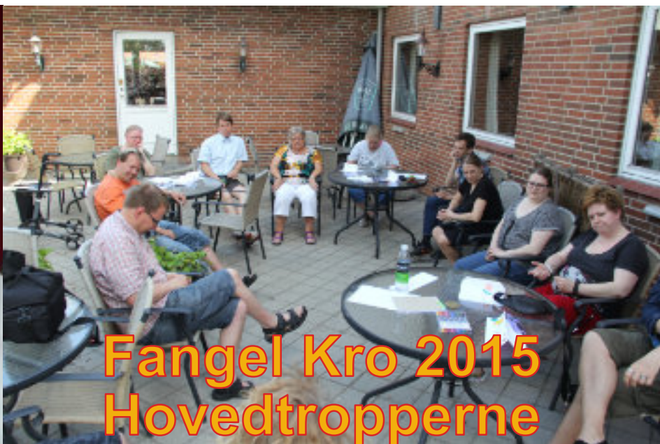
Fangel Kro 2015 Hovedtropperne