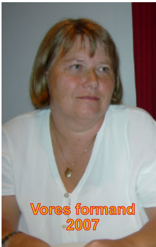
Vores formand 2007