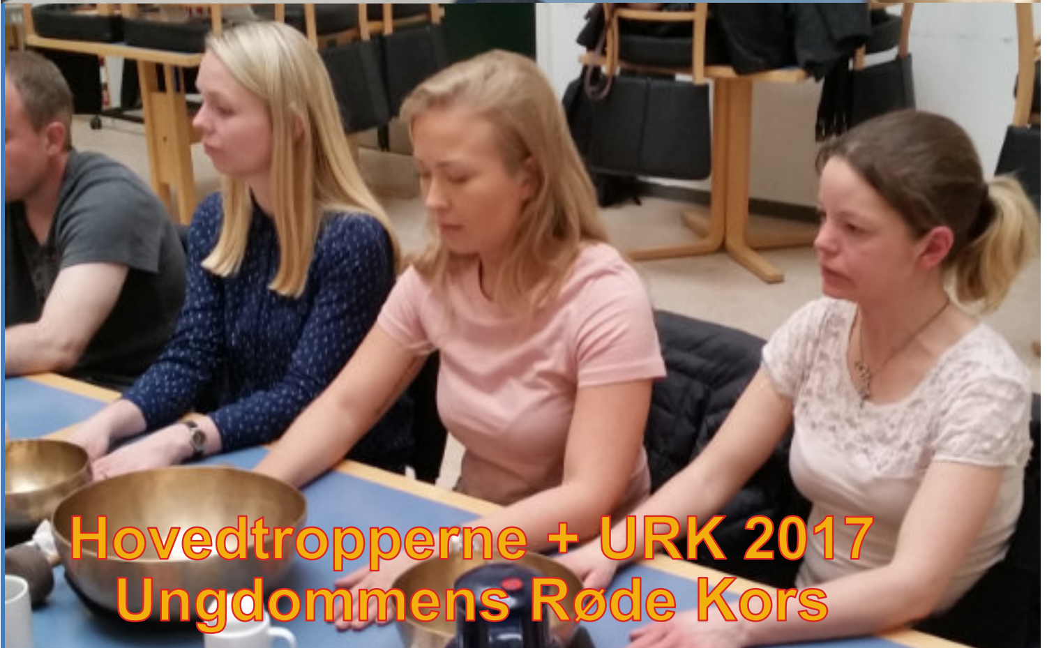
Hovedtropperne + URK 2017 Ungdommens Røde Kors